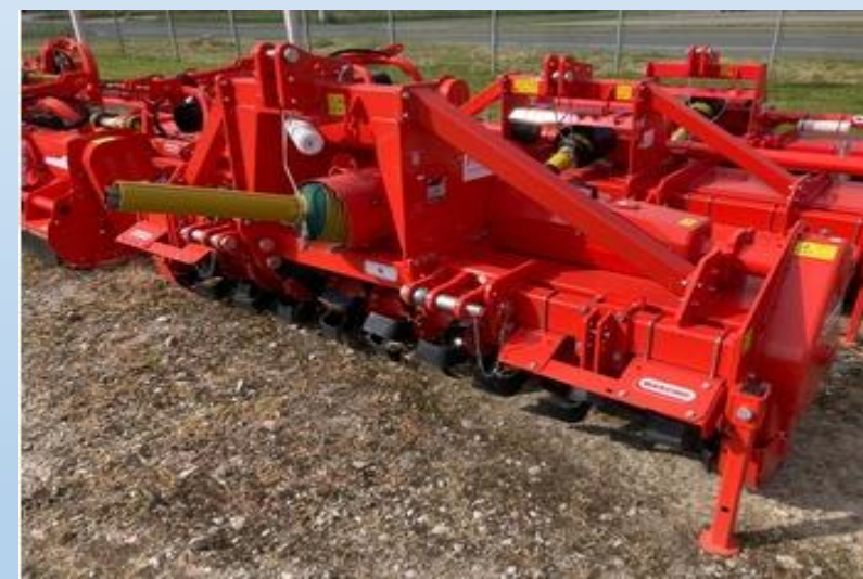
klepelmaaier met frees