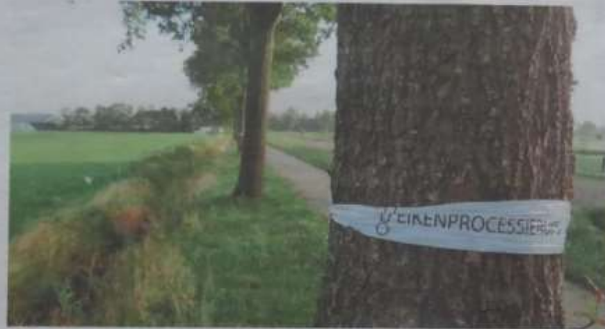
Boom met lint aan het Westeinde, Inge Vuijk.

De eikenprocessierups wordt in het land vooral bestreden met pesticiden. De bestrijding door Boermarke Wapserveen gebeurt op een natuurlijke manier. Door een gebied waar veel eiken staan ook aantrekkelijk te maken voor de natuurlijke vijanden van de processierups, verwacht Boermarke de komende drie jaar een afname van het aantal processierupsen. Boermarke gaat hiervoor dertigduizend krokussen en wilde planten in de bermen