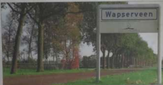
Deze aanleg van 500 roden wordt in de komende jaren in Wapserveen gemaakt om het aanpakken van eikenprocessierups te de bestrijding van de eikenprocessierups te ondersteunen.

De eikenprocessierups heeft in het land een groot aantal natuurlijke vijanden. De bestrijding aan Boermarke Wapserveen gebeurt op een natuurlijke manier. Door een gebied met een eikenbos met eikenprocessierups te maken van de natuurlijke vijanden van de processierups, worden de schade aan de bomen door de processierups beperkt. Het plan wordt ook ondersteund door het Westerveld Natuurpark. Het plan wordt ook ondersteund door het Westerveld Natuurpark. Het plan wordt ook ondersteund door het Westerveld Natuurpark.