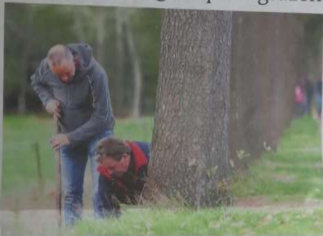
Tussen de eiken worden planten geplant. De rupsen moeten aantrekken die de afges van de eikenprocessierups eten.

Om te voorkomen dat de eikenprocessierups verder oprukt, komen inwoners van Wapserveen dit najaar in actie. Sleutelwoorden: natuurlijk en duurzaam.